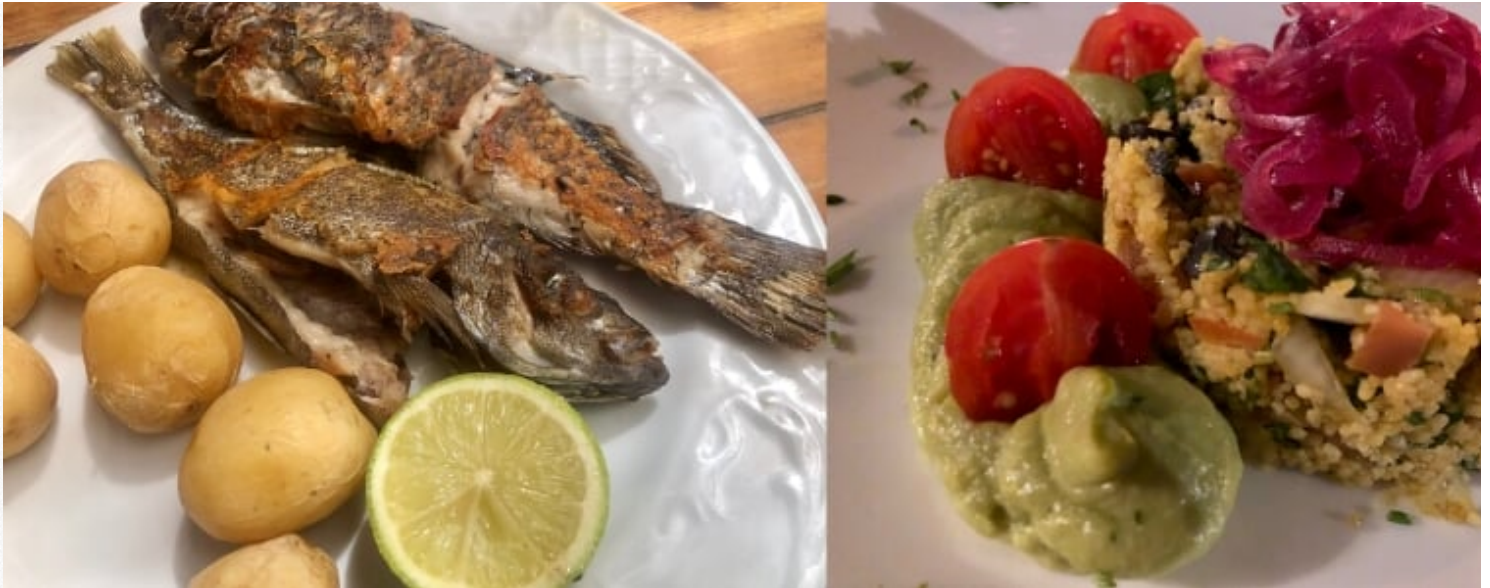
Lekker eten kan je zeker op Gran Canaria. Links visgerecht in Puerto de las Nieves, rechts een verrukkelijke tabouleh in het restaurant het Lopesan Baobab Resort.