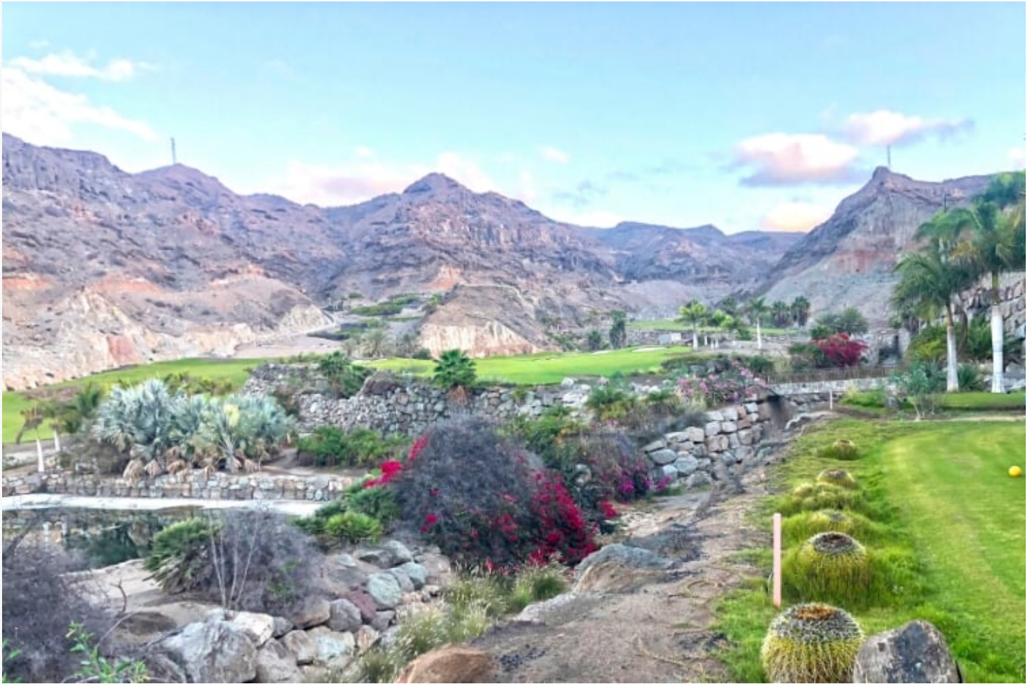
Golfcourse Anfi Tauro in een indrukwekkende omgeving.

Het schilderachtige plaatsje Puerto de Mogán is een bezoek meer dan waard.